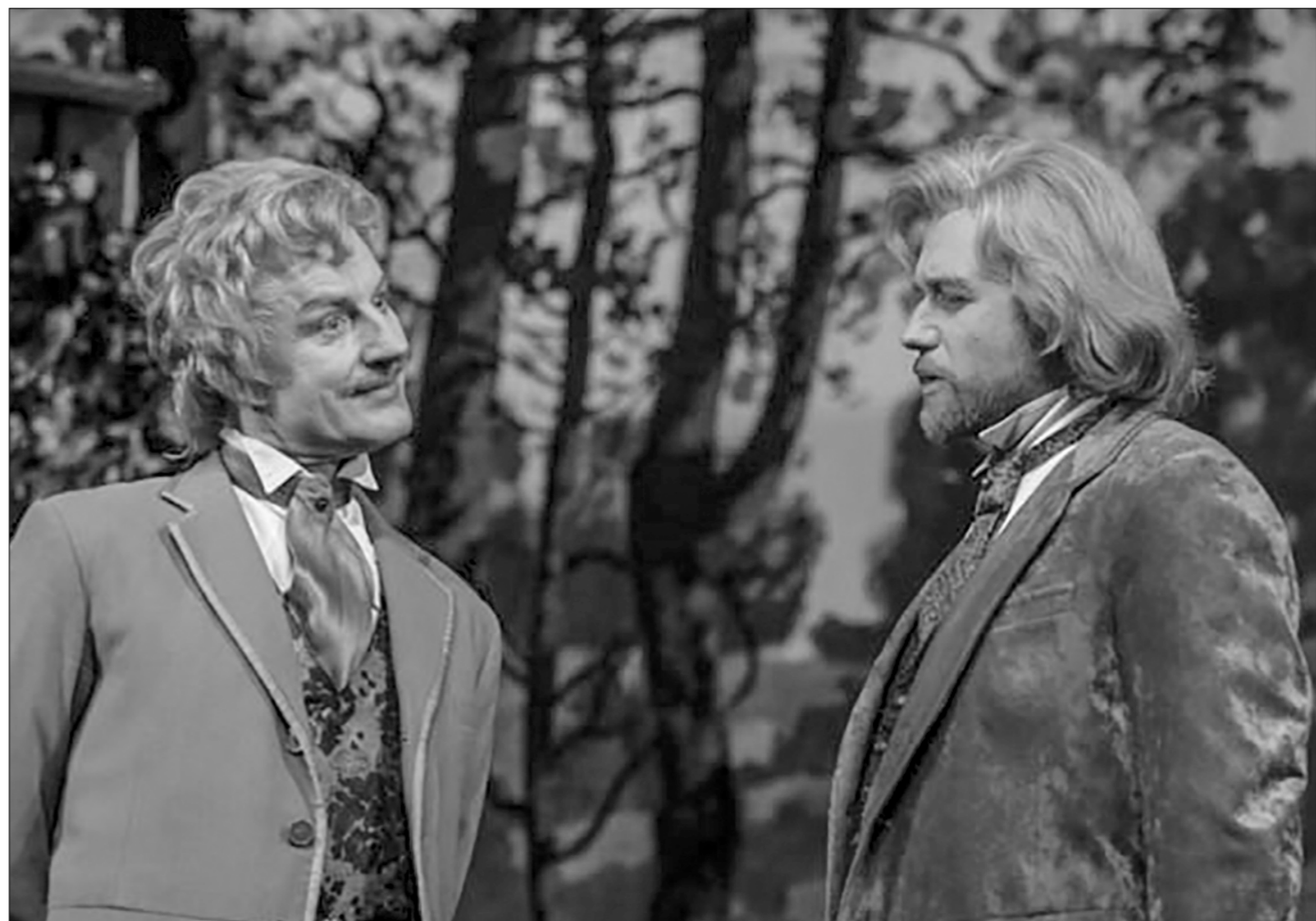
□ Но та великолепная дорониная постановка блистала и целым рядом других актёрских работ.