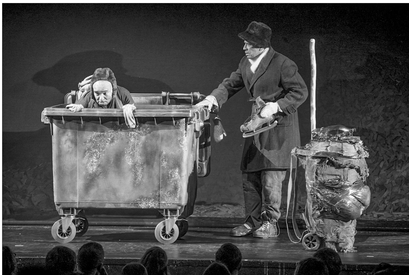
□ А вот в новом (абсурдном!) спектакле Несчастливцев в сцене встречи с Несчастливцевым вылезает из мусорного бака.