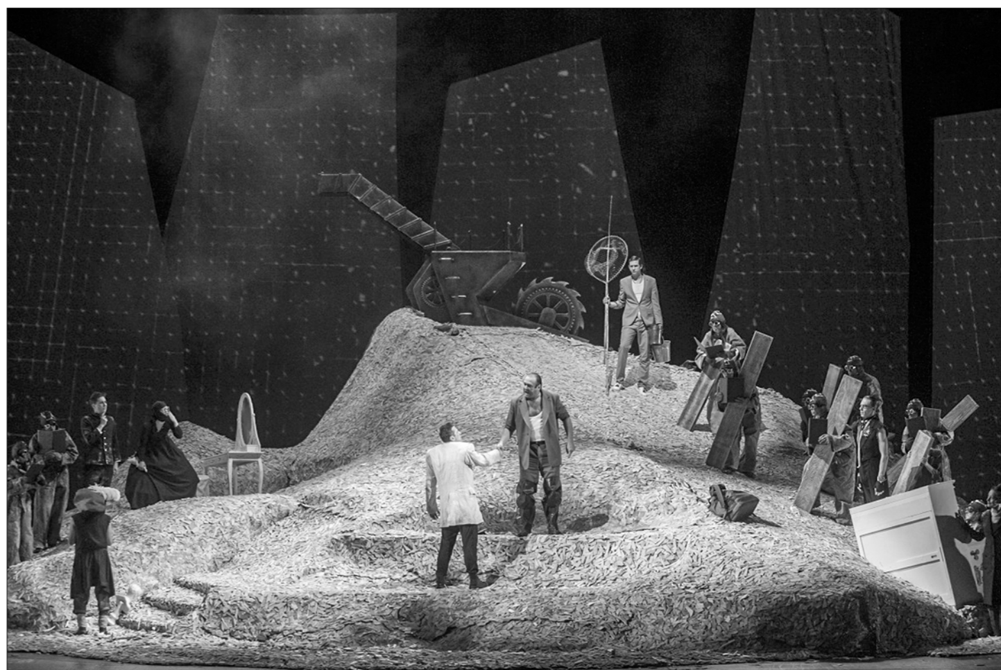
□ Огромной горой опилок, собственно, и обернулся на сцене нынешнего МХАТ знаменитый «Лес» А.Н. Островского.