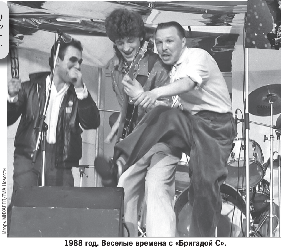
1988 год. Веселые времена с «Бригадой С».