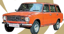
Автомобиль «Жигули 2102»