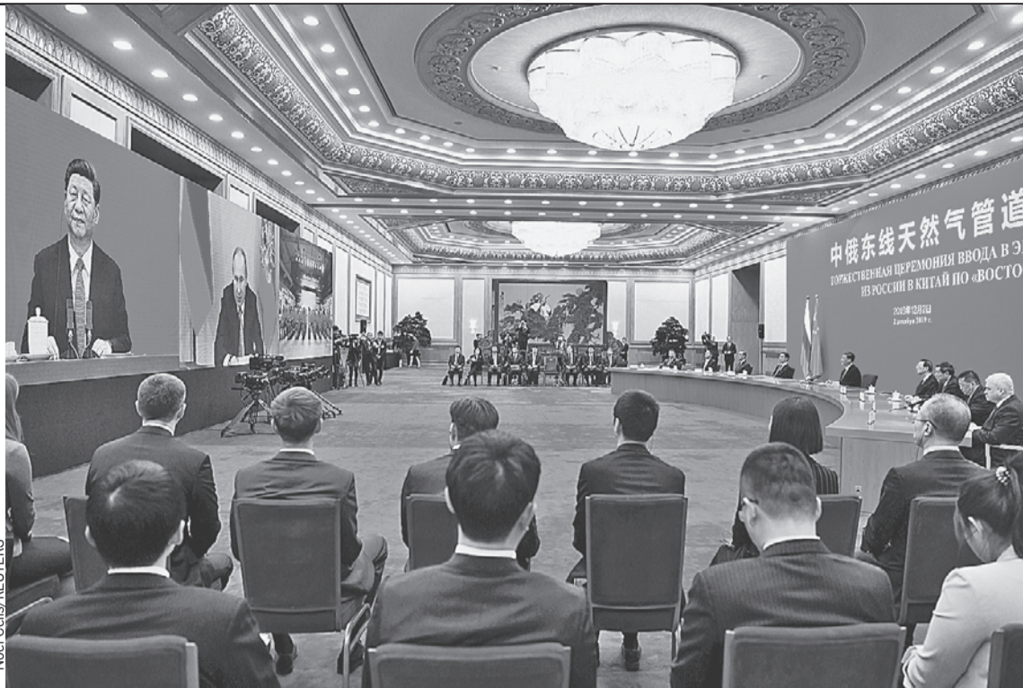
А так торжественно открытие «Силы Сибири» выглядело в Пекине. Все в красных коммунистических тонах, за столом - председатель Си Цзиньпин, на левом экране - он же, на центральном - президент Путин, на правом - газовики.

2200 километров трубопровода проложены по тайге, а это почти в 2 раза больше длины «Северного потока! Проектная мощность - 38 миллиардов кубометров газа в год. По прогнозам главы Минэнерго Александра Новака, за 30 лет, на которые подписан контракт на поставку газа в Китай, Россия получит более 300 миллиардов долларов. «Сила Сибири» связала Иркутский и Якутский центры газодобычи и позволит газифицировать российские населенные пункты вокруг Ленска, Нерюнгри, Скворородино и Благовещенска. То есть «Сила Сибири» - важнейший внешнеэкономический проект года, а возможно, и десятилетия. Но он имеет огромное значение и для внутреннего рынка - газ