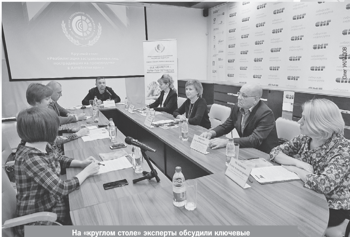
На «круглом столе» эксперты обсудили ключевые вопросы предоставления государственных услуг.

Всего в 2019 году 488 человек получили производственные травмы, для 24 человек увечья стали смертель-