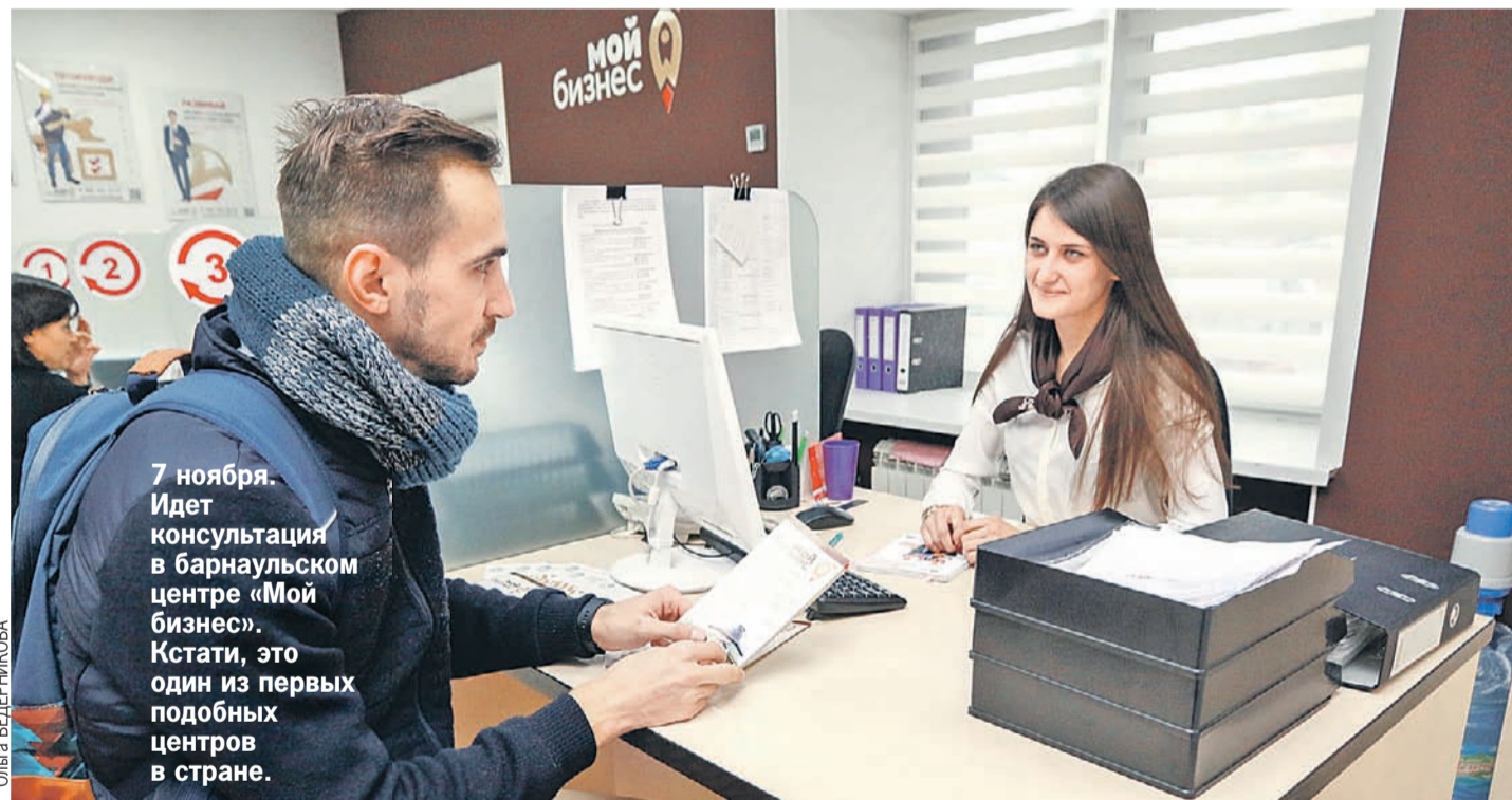
7 ноября. Идет консультация в барнаульском центре «Мой бизнес». Кстати, это один из первых подобных центров в стране.