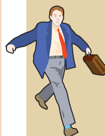
Дмитрий ПОЛУХИН/Комсомольская правда

14 лет - минимальный возраст для обращения в центр «Мой бизнес». Верхней планки нет. Более 416 800 услуг оказано предпринимателям и начинающим бизнесменам.