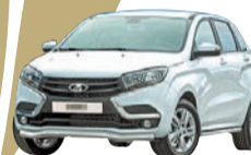
Автомобиль «Лада X-ray»