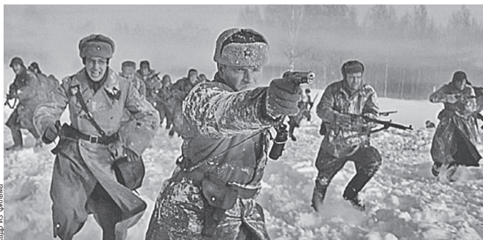
Это фильм не о самодурстве глупых особистов и командиров, а о подвиге и самопожертвовании русского солдата.