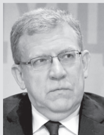
Алексей КУДРИН / «КП» - Санкт-Петербург

(Глава Счетной палаты Алексей КУДРИН - на Общероссийском гражданском форуме.)