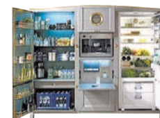
Самый дорогой холодильник в мире Meneghini La Cambusa