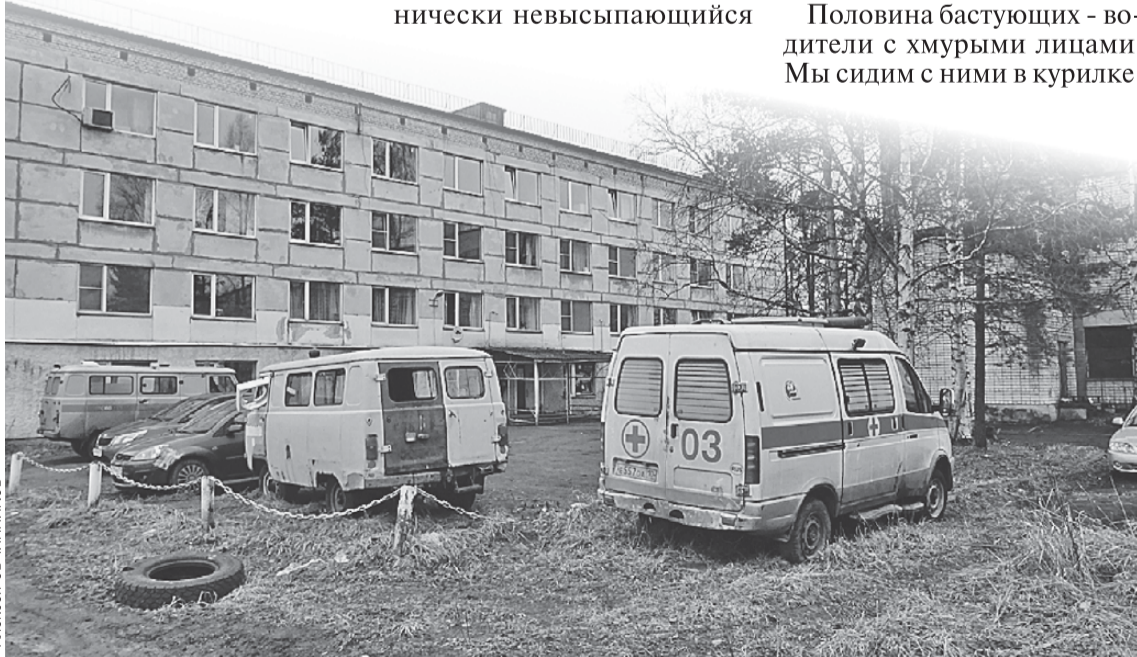
В прошлом году подстанцию скорой в поселке Ладва едва не «оптимизировали».

- Надо же, как это все работает! - удивляются фельдшеры. - До этого наши жалобы гуляли по инстанциям,